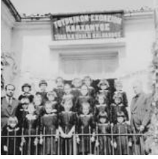
Τουρκικό Δημοτικό Σχολείο Κάλχαντος Σχολικό Έτος 1964-65