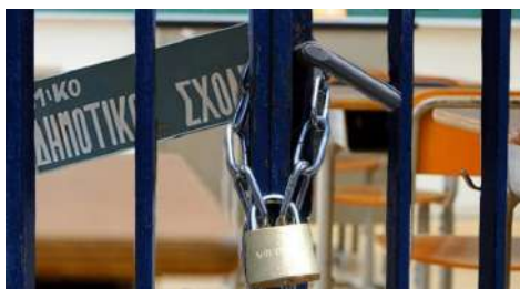
Palaio Katramio (Karaköy) in der Präfektur Xanthi geschlossen.

Laut dem getroffenen Beschluss werden die türkischen Grundschulen in den Dörfern Vyrsini (Hacıören), Kymi (Keziren) und Plagia (Payamlar) in der Präfektur Rodopi und