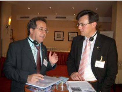
24-28 Mayıs 2006 tarihleri arasında, Avrupa Halkları Federal Birliği (FUEN)

tarafından Almanya'nın tanınmış dört azınlığından biri olan Sorb azınlığının yaşadığı Bautzen kentinde düzenlenen 51. Uluslar Kongresi'nde ana tartışma konusunu Avrupa'da çok dillilik oluşturdu.