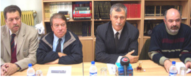
Azınlık Danışma Kurulu Üyeleri

bulunacak olan bu karara karşı PASOK gibi sosyalist bir partinin milletvekillerinin aşırı milliyetçi tutumlarının bölge için zararlı olduğunu belirterek önergeyi veren PASOK milletvekillerini kınadı. Toplantıda son olarak Azınlık Danışma Kurulu'nun yeni tüzüğü tartışıldı. Azınlık Danışma Kurulu'nun hazırlanan yeni tüzüğünün taslağı toplantı esnasında Kurul üyelerine sunuldu. Yapılan değerlendirmeler sonucunda Azınlık Danışma Kurulu'nun yeni tüzük taslağı üzerinde uzlaşmaya varıldı, tüzüğün oylanması bir sonraki toplantıya bırakıldı. Tüzük taslağı üzerindeki değerlendirmelerin ardından toplantı sona erdi.