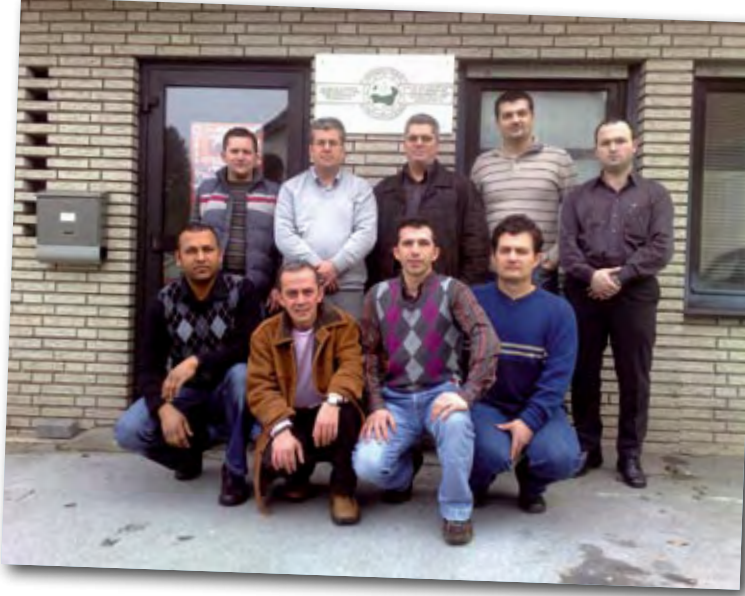
Yeni Yönetim Kurulu üyeleri ve görevleri aşağıdaki gibidir:

2. Dönem Yönetim Kurulu'nun oybirliği ile aklanmasının ar-